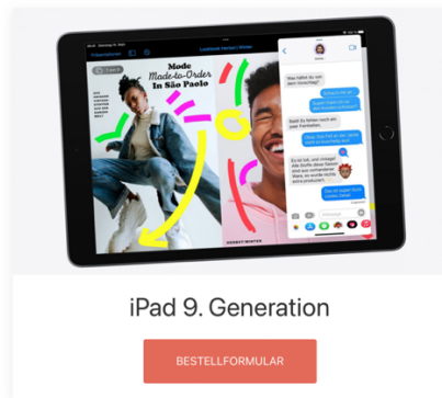
iPad 9. Generation