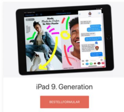
iPad 9. Generation